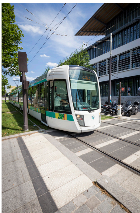
Voie de tramway